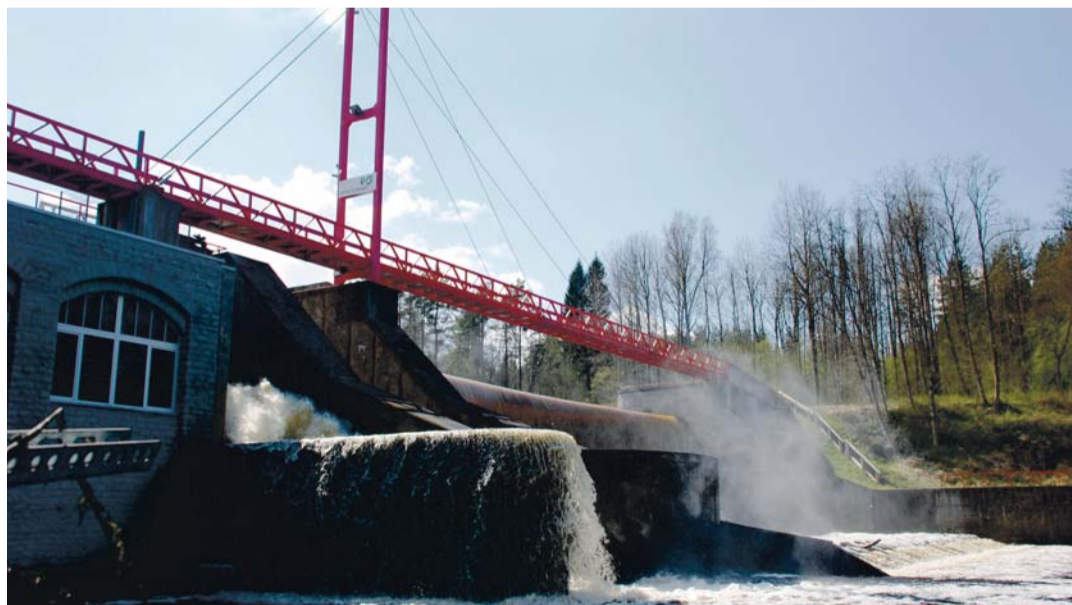
Kuigi Linnamäe hüdroelektrijaam sai uue omaniku, ei muutu seal vähemalt praegu midagi – Wooluvabrik OÜ tahab säilitada kõik nii, nagu on seni olnud.

Tammi lõhkumisega kaoks ka Linnamäe paisjärv, mis on kohalike jaoks oluline puhkepaik. Jõelähtme vald, kellele